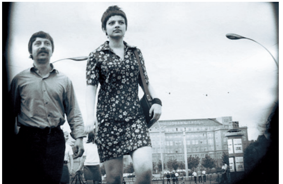
DDR-Künstler*: Von Dissidenten lernten die Stasi-Dichter das verdeckte Schreiben